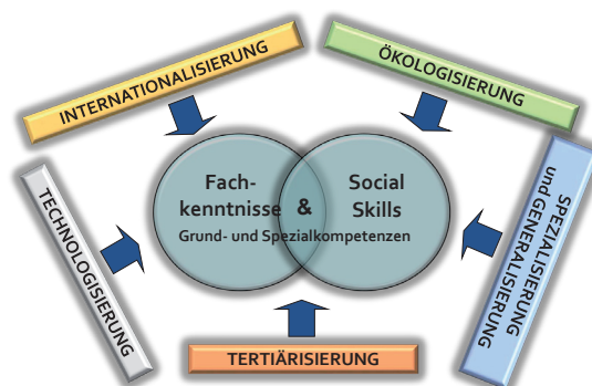
Abbildung 1: Entwicklungen und Einflussfaktoren auf erforderliche Kompetenzen

Das Konzept »Industrie 4.0« z.B. war zum Zeitpunkt, als das AMS-New-Skills-Projekt gestartet wurde, noch nicht explizit bekannt, die dahinterstehende Thematik einer zunehmenden Digitalisierung der Arbeitswelt unter anderen Begriffen in den Diskussionen hingegen bereits allgegenwärtig. Digitalisierung ist aber nur einer von vielen Einflüssen, die zu Veränderungen in der Arbeits- und Berufswelt führen. Wie Abbildung 1 zeigt, wurden im AMS-New-Skills-Projekt als weitere Treiber der Veränderung generell eine zunehmende Technologisierung, Internationalisierung und Ökologisierung, eine fortschreitende Tertiärisierung und eine vielfache Spezialisierung bei gleichzeitiger Generalisierung identifiziert. 2 Faktoren, die sich wechselseitig beeinflussen, vielfach bedingen und bis zu einem gewissen Grad durch unternehmerische Entscheidungen auch gestaltbar sind.