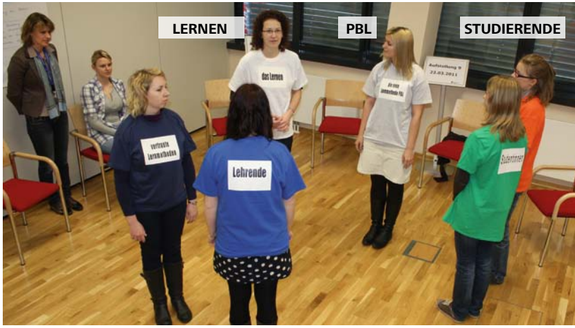
Abb. 5: Beispiel Aufstellung 9 (nach Hinzustellen von PBL)