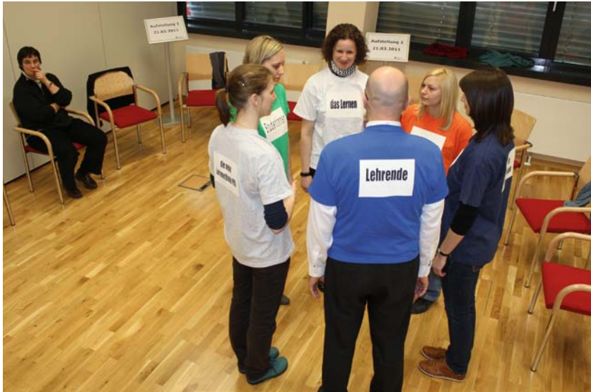
Abb. 6: Beispielhaftes Endbild der Aufstellungen eines partnerschaftlichen Systems

dass Lernen grundsätzlich mit vermeintlich weiblichen Eigenschaften verbunden ist. Als Beispiel: Lernen ist im Wesen ein Miteinander und braucht kein Dominanzverhalten einzelner AkteurInnen, insbesondere nicht der Lehrenden.