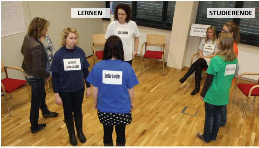
Abb. 4: Beispiel Aufstellung 9 (vor Hinzustellen von PBL)

Alles in allem zeigt sich durch die Analyse, dass im Lernsystem andere Themen als die neue Lernmethode PBL und insbesondere das Lernen Vorrang haben. Im Speziellen ist damit das Thema Macht seitens der Lehrenden angesprochen, wodurch häufige Konfrontationen zwischen Lehrenden und Studierenden - in erster Linie Studenten - die Folge sind. Aber auch negative Spannungen zwischen den Studenten und Studentinnen selbst scheinen die Studierenden vom Wesentlichen, dem Lernen, abzulenken. Infolge dessen hindern diese Machtkämpfe nicht nur PBL, sondern vor allem auch das Lernen an seiner Entwicklung und Entfaltung.