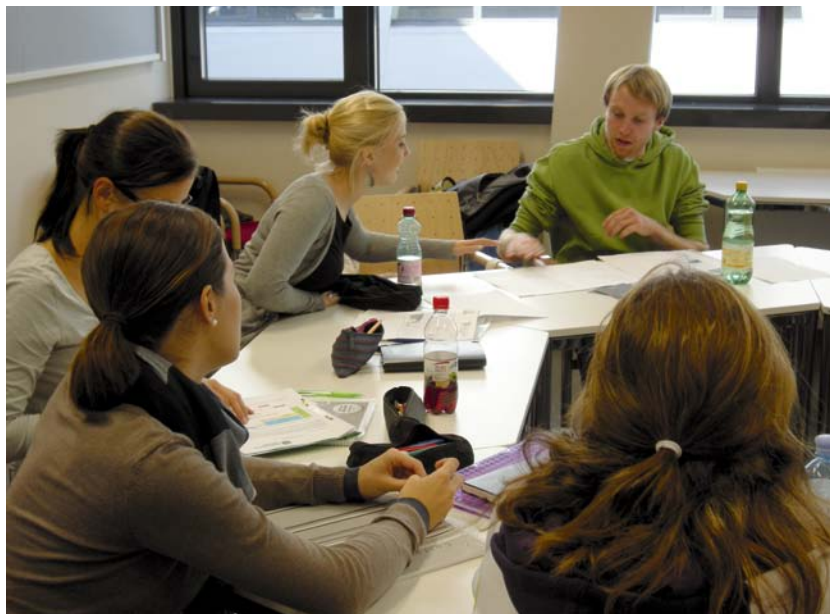
Abb. 1: Beispiel einer PBL-Session an den FHWien-Studiengängen der WKW